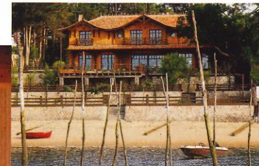
De g. à dr. : une chambre de l' Hôtel Côté Sable ; le Lodge SHL , sur la plage du Canon, une merveille architecturale ; incontournable, la boutique de déco N Home.